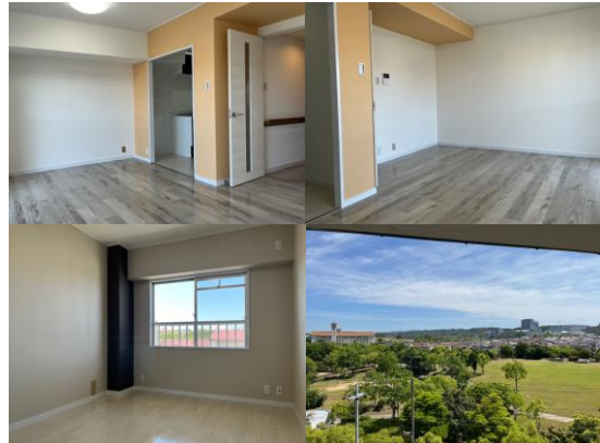
■リビング/洋室/和室からの眺望

●神戸市西区学園西町5丁目8-2 ●神戸市営地下鉄西神山手線「学園都市」駅より徒歩8分 ●鉄筋コンクリート造6階建の5・6階部分 ●所有権 ●昭和60年3月築 ●全部委託管理(巡回) ●管理費/月額5,800円 ●修繕積立金/月額11,000円 ●その他/管理会費:月額1,000円、組合費:月額700円 ●駐車場/敷地内空有り(月額6,000円) ●現況/空室 ●引渡日/ご相談 ●仲介